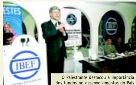
O Palestrante destacou a importância dos fundos no desenvolvimento do País

No Espírito Santo, onde contamos com seis instituições – Escelsos (Escelsa), Banestes (Banestes), Arus (Aracruz), Funssest (CST), Faeces (Cesan) e Garoto (Garoto) –, constituindo um