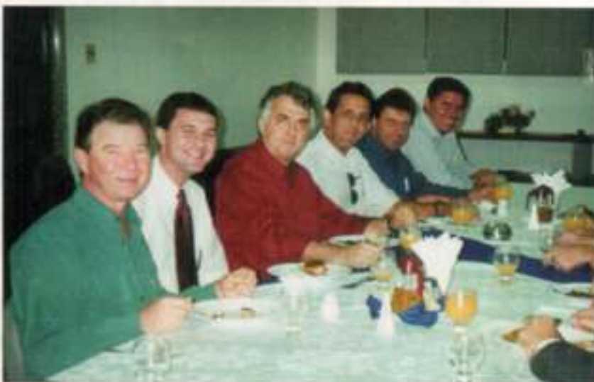
Encerramento da visita durante um descontraído almoço

ma descontraído e propício ao início de bons negócios. Ao final da visita técnica os associados saíram satisfeitos com o que puderam conferir e viram o porquê de o Grupo Águia Branca ser um dos maiores exemplos de sucesso do Espírito Santo.