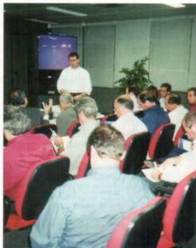
Associados Ibef durante a palestra

Durante o passeio, o grupo de associados teve contato ainda com uma verdadeira raridade: um pequeno ônibus que foi usado na novela "Tieta" (transmitida pela Rede Globo), conhecido como "Princesinha do Agreste". O veículo está até hoje no pátio da empresa, e permanece intacto. Em contraste com os arrojados modelos de ônibus que se conhece hoje, esta "marinete" verde com laranja é um símbolo vivo de como evoluiu o Grupo Águia Branca.